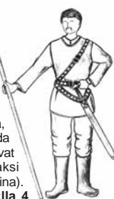
Jatkuu s:lla 4

peräinen sana pokosta tarkoitti silloin kuntaa, siis hallintopiiriä sekä kirkkopitäjää. Naapuripokostat olivat: Tillitsä (silloin Vzdylic), Saaritsa, Ijussa, Jastreбина ja Vruuda (mainitut pokostat ovat säilyneet viimeajaksi ortodoksisuurakuntina).