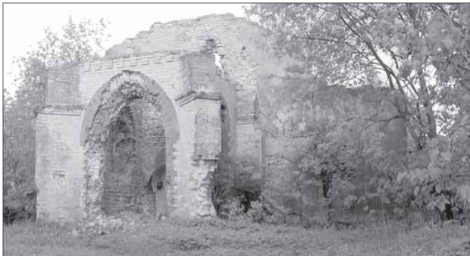
Moloskovitsan kirkon rauniot

dan jälkeen asuimme Volosovassa. Vanhempieni olivat uskovaisia ihmisiä. Olen seurakunnan jäsen seurakunnan perustamisajasta v.1989.