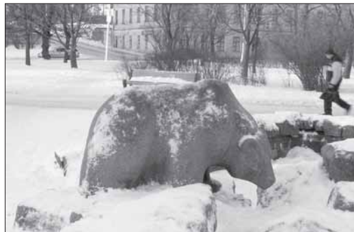
Современный Выборг – город, где порой весьма необычно сочетается старое и новое. Гранитный медведь «пьет воду» из фонтана на Пионерской площади. Ранее эта скульптура украшала фронтон железнодорожного вокзала Выборга, разрушенного в 1941 году

– Действительно, участвовал на первых порах. Был даже первым председателем. Но думаю, что мой вклад в работу общества невелик. Мне не понравилось преклонение перед финляндскими финнами. Знаете, все ждут эту гуманитарку, ее депят, из-за нее скандалы. Да и к тому же тогда все были настроены лишь на выезд в Финляндию. При чем здесь тогда возрождение Ингерманландии? В общем, я не видел работы для себя и быстро отошел от ингерманландских деп, уйдя с головой в бизнес. Еще мне не нравилось, что наша организация была слишком сильно завязана на церковный приход. А я по своим взглядам убежденный атеист. Из-за этого иногда возникала напряженность. Вы скажите свои взгляды и сразу слышите возмущение «Уважайте чувства верующих!». Я улыбаюсь и отвечаю «Уважайте чувства атеиста!». Я нисколько не против верующих всех религий и конфессий. Вообще атеизм – это тонкий лег, по которому может пройти один человек, но нация, государство не может существовать без определенного сдерживающего, стабилизирующего начала в форме религии. Иначе наступает хаос. Но не надо в тех или иных формах давить на людей, имеющих другие взгляды. В юности я был хиппи и мне очень нравится