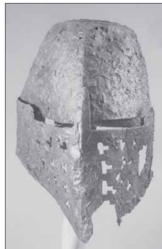
«Шлем Торгильса Кнутссона» – фотография этой уникальной археологической находки из Швеции можно видеть в музее Выборгского замка. По решению маршала Торгильса Выборга был основан в 1292 году

их философия, проповедующая пацифизм и абсолютную терпимость к любым убеждениям.